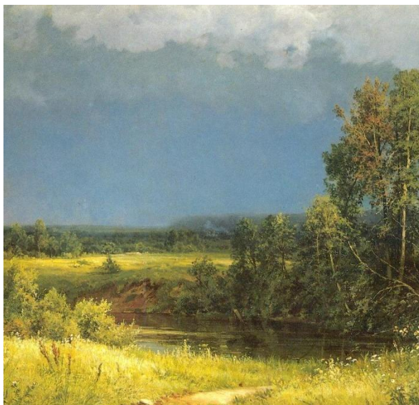
Иван Шишкин. Перед грозой. 1884