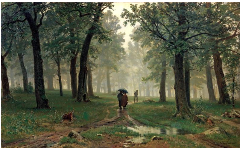
Иван Шишкин. Дождь в дубовом лесу. 1891