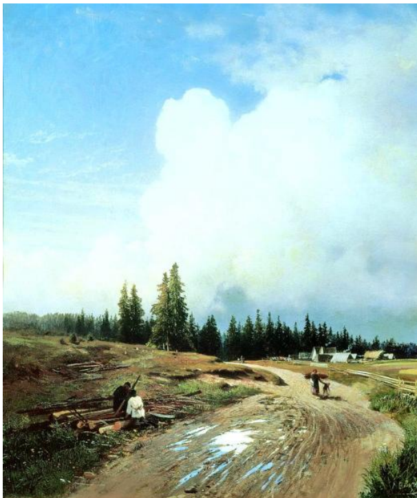
Фёдор Васильев. После грозы