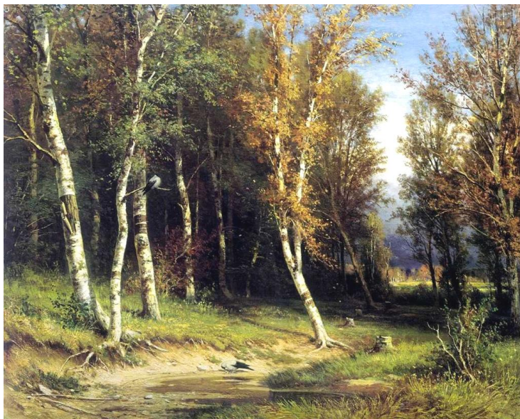
Иван Шишкин. Лес перед грозой. 1872

Я поклонился. Пророк цокнул языком, потирая ладонью смуглую лысину: - Колесо потерял. Отыщи-ка.