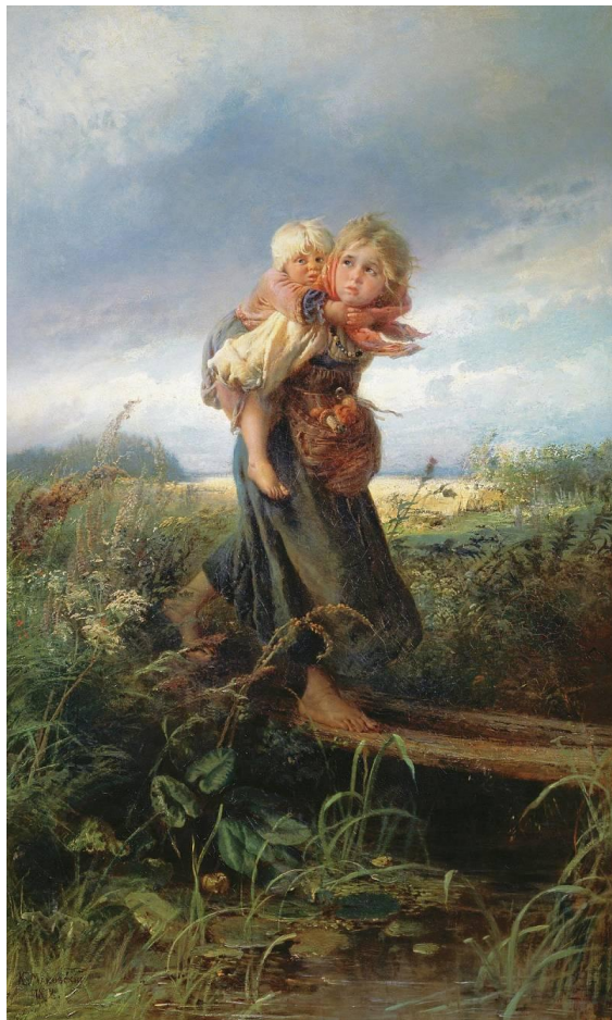
Константин Маковский. Дети, бегущие от грозы. 1872 г. Государственная Третьяковская галерея. Москва. Холст, масло 167x102

Июнь-июль 1990 Из цикла «Книжка для детей»