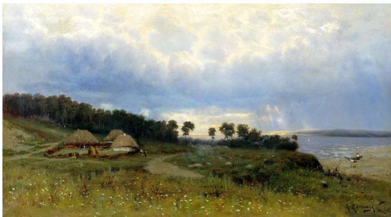
Константин Крыжицкий. Перед дождём