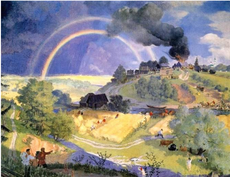
Борис Кустодиев. После грозы. 1921