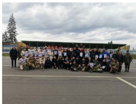
Военно-патриотическая игра «Сибирский Щит»

Молодежь активно вовлекалась в проектную деятельность. В ходе реализации инфраструктурного проекта «Территория Красноярский край» 10 проектных идей получили финансовую поддержку в размере 264,5 тыс. рублей, а в рамках слета инициативной молодежи поддержку получили 12 проектов на сумму 364,6 тыс. рублей.