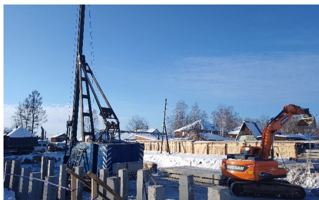
Строительство 60-ти квартирного дома в с.Подтесово

Всего в 2023 году было расселено 2310,2 м 2 аварийной жилой площади. Пятидесяти четырем семьям (жители с.Верхнепашино, пгт.Подтесово, с.Абалаково) были предложены различные варианты расселения и компенсаций. Для 14 –ти семей были приобретены жилые помещения в городах Красноярск и Лесосибирск и