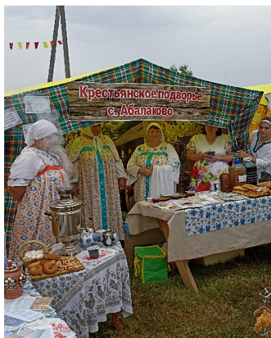
Фестиваль «Енисейская уха»