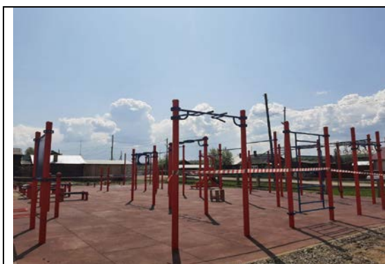
Площадка ГТО п.Новокаргино

В отчетном периоде были запланированы завершение строительства и ввод в эксплуатацию спортивных площадок для подвижных игр в п. Высокогорский и п. Подтесово, но, к сожалению, по вине подрядчика (ООО «ПРОМСФЕРАСТРОЙ») работы не были завершены в срок. Подрядчик обязуется завершить работы в 2024 году.