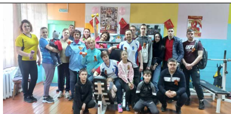
Спортивный клуб «Факел» (с. Верхнепашино)

В районе работают 8 клубов по месту жительства: «Энергия» (с. Озерное), «Водник» (п. Подтесово), «Атлант» (с. Усть-Кемь), «Медведь» (п. Шапкино), «Факел» (с. Верхнепашино), «Олимп» (с. Абалаково), «Белый медведь» (п. Высокогорский), «Титан» (п. Новокаргино), количество занимающихся в клубах составляет 1360 человек. В отчетном периоде, в рамках краевой субсидии на поддержку спортивных клубов по месту жительства, приобретен инвентарь и оборудование на сумму 586 тыс. рублей.