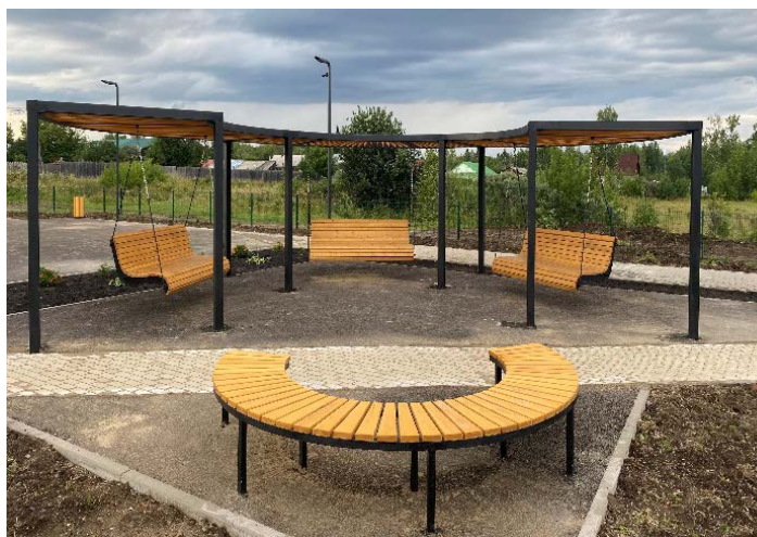
Парк «Дружба поколений» с.Верхнепашино

На территории Абалаковского сельсовета был реализован проект по комплексному благоустройству общественной территории «Сердце нашего села». На реализацию мероприятия было выделено 49,4 млн. рублей. В рамках мероприятия установлена автобусная остановка в безопасной зоне для посадки и высадки школьников, современная хоккейная коробка, выполнены работы по устройству пешеходных дорожек по ул. Нефтяников с новым ограждением, благоустроено мемориальное место «Сад Памяти» (заменено ограждение, уложена брусчатка, установлены скамейки и урны, именная табличка «Сад Памяти»), устроена территория у дома культуры, установлены скамьи для отдыха, навесы с качелями, детский игровой комплекс; модернизирована система уличного освещения на всей территории благоустроенного участка (заменены опоры и светильники). На территории у озера установлено ограждение, устроена смотровая площадка с уличной мебелью для отдыха, арт-объект «Сердце», двойные качели с площадкой и подпорной стенкой.