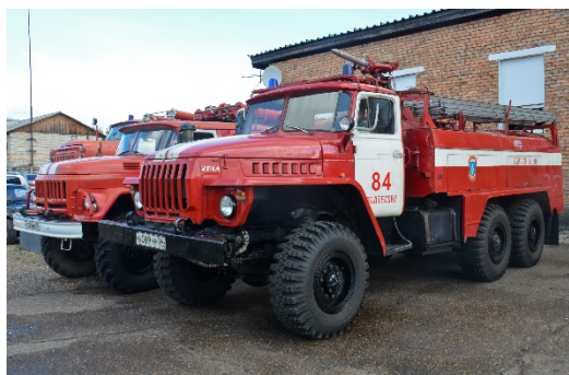
Автомобили для добровольных пожарных дружин

В 2023 году пожарные подразделения МКУ «Управление по ГО, ЧС и безопасности Енисейского района» выполнили 25 выездов, из них на 10 на загорание в жилом секторе, 11 на тушение сухой травянистой растительности и 4 ложных выезда.