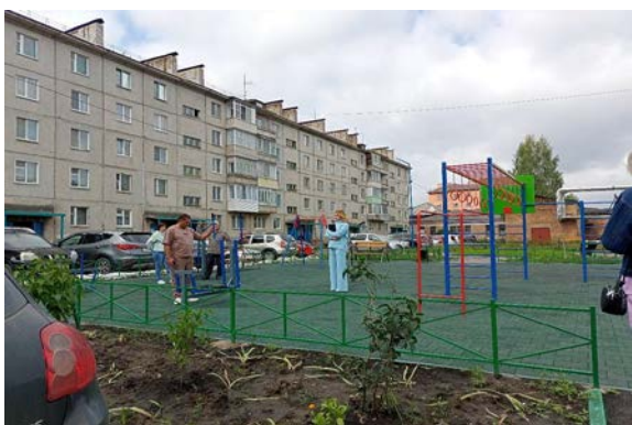
п. Подтесово по ул. Калинина, 33

- благоустройство дворовых территорий в п. Подтесово по ул. Калинина, 11, ул. Калинина, 59, пер. Заводской, 9, пер. Заводской, 11, пер. Заводской, 13 и с. Абалаково, ул. Нефтяников, 1А - уложено асфальтовое полотно, установлены скамейки, урны для мусора, освещение;