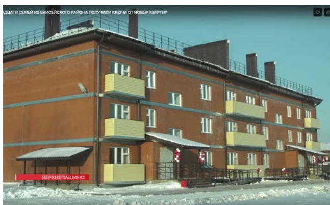
25-ти квартирный дом в с.Верхнепашино

В течение 2023г. администрацией п. Подтесово приобретены жилые помещения, а так же выплачена денежная компенсация с мерами дополнительной поддержки (субсидии) собственникам жилых помещений на сумму 92,1 млн.руб.