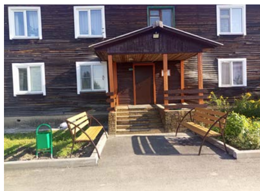
с. Абалаково, ул. Нефтяников, 1А

- благоустройство дворовой территории в п. Подтесово по ул. Калинина, 33 - уложено резиновое покрытие на территории детской спортивной площадки, установлено ограждение детской спортивной площадки, три тренажера, спортивный комплекс, скамейки, урны, освещение.