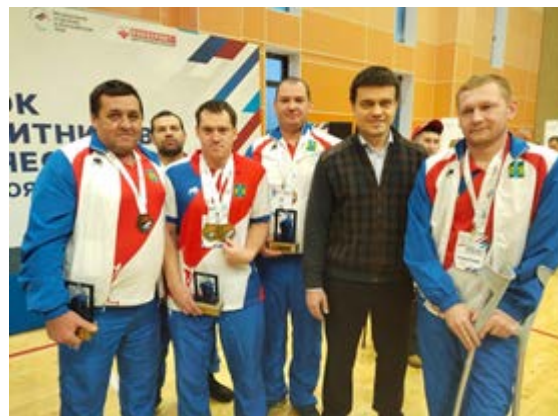
Участники спартакиады «Защитники Отечества»

В части развития системы подготовки спортивного резерва спортшколой реализовывались дополнительные общеразвивающие программы по спортивной подготовке и подготовке спортивного резерва по 13 видам спорта, которые разбиты на 3 отделения: отделение игровых видов, отделение циклических видов спорта, отделение единоборств. По итогам комплектования на 1 января 2024 года в спортивной школе занимается 465 человек.