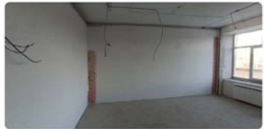
МБОУ Подтесовская СОШ № 46