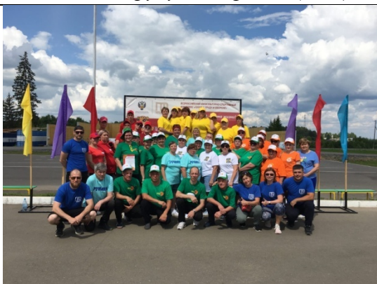
«Готов к труду и обороне» (ГТО)