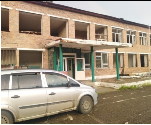
МБОУ Подгорновская СОШ № 17